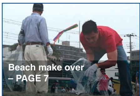
Beach make over - PAGE 7