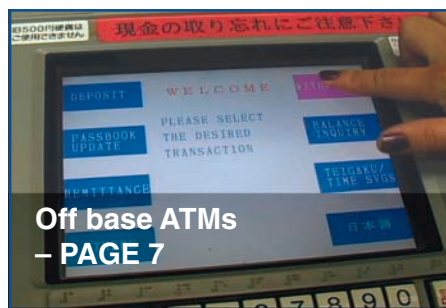
Off base ATMs - PAGE 7